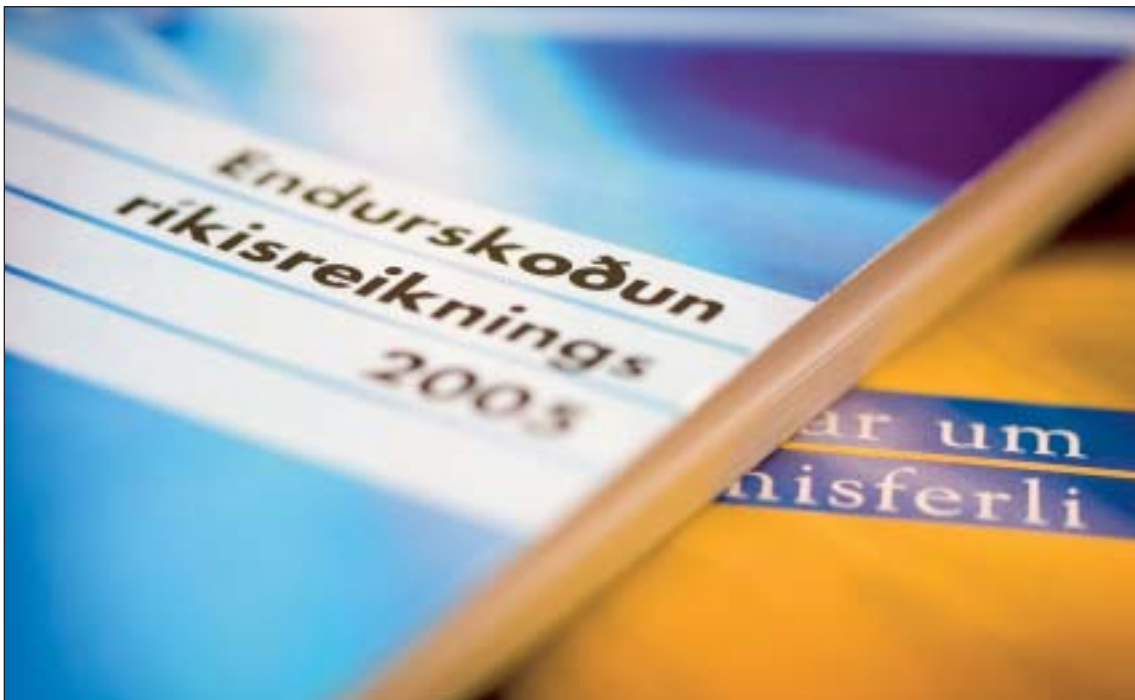
Tvö af útgáfuritum stofnunarinnar árið 2006

Á árinu 2006 voru gerðar fjölmargar breytingar á heimasíðunni til að auðvelda fötluðum að notfæra sér það efni sem þar er birt. Í tengslum við þær breytingar mótaði stofnunin sér einnig aðgengisstefnu fyrir fatlaða og birti hana meðal stefnumála sinna. Nær allt efni á vef Ríkisendurskoðunar stenst nú þær viðmiðunarkröfur um aðgengismál sem alþjóðlegi vinnuhópurinn Web Content Accessibility Guidelines Working Group hefur sett fram í staðlinum WCAG 2.0 af gerð A. Þetta þýðir að hann er meðal annars aðgengilegur blindum sem nýta sér heimasíður með hjálp skjálesara, sjónskertum sem þurfa sérstaklega stórt letur, lesblindum sem hentar annar bakgrunnur en venja er að nota og hreyfihömluðum sem eiga erfitt með að nota mús við að ferðast um vefsíður. Gera má ráð fyrir að mörg þessara atriða auðveldi einnig öldruðum að nýta sér vef stofnunarinnar.